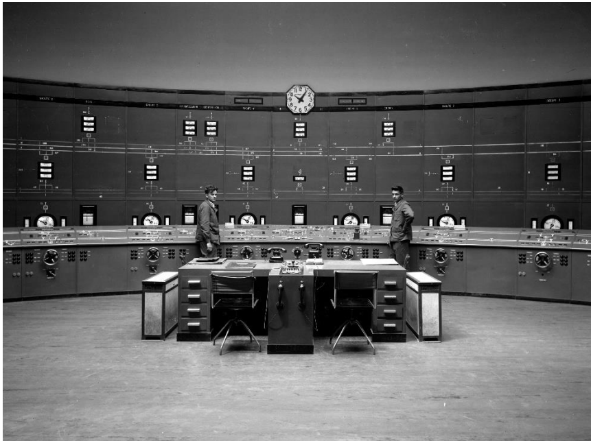
Salle de commande, 1933.

A travers les images qui jalonnent la construction et la reconstruction de la centrale de Kembs, se dessinent l'histoire des hommes et des représentations qui en font un lieu de mémoire européenne.